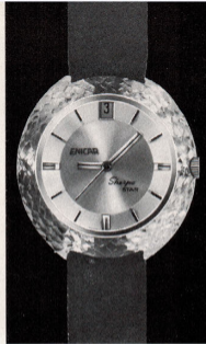
144-49-01 Sherpa STAR, étanche, 24 rubis, Incabloc, grande seconde, ca- lendrier, tout acier ou or 18 ct ou plaqué or. Sherpa STAR, wasserdicht, 24 Steine, Incabloc, grosse Sekunde, Kalender, Ganzstahl oder Golddoublé.