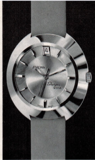
144-49-01 Sherpa STAR, étanche, 24 rubis, Incabloc, grande seconde, ca- lendrier, tout acier poli. Sherpa STAR, wasserdicht, 24 Steine, Incabloc, grosse Sekunde, Kalender, Ganzstahl poliert.