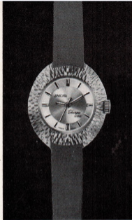
764-01-01 Sherpa STAR, étanche, 24 rubis, Incabloc, grande seconde, tout acier ou or 18 ct ou plaqué or. Sherpa STAR, wasserdicht, 24 Steine, Incabloc, grosse Sekunde, Ganzstahl oder Gold 18 Kt. oder Golddoublé.

Modelli registrati N° 36 213 Richiesta di brevetto N° 1411/65