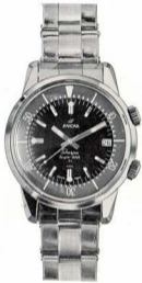
エニカ シェルパ スーパーダイブ 商品番号 EG-11-121

40mm 24時間目盛回転時差計付 自動巻 カレンダー付 オール ステンレス製 超完全防水 耐 耐圧30気圧 水深300米 耐震耐磁耐熱装置付 舶来額付 ¥36,000