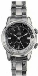
エニカ シェルパ スーパージェット 商品番号 EG-11-127

43mm 世界地名入りダイヤル及 24時間目盛時差計付自動巻 カレンダー付 オールステンレ ス製 超完全防水 耐圧30気圧 水深300米 耐震耐磁耐熱装置付 舶来額付 ¥39,000