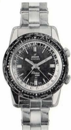
エニカ シェルパ ガイド 商品番号 EG-11-131

43mm 世界地名入りダイヤル及 24時間目盛時差計付自動巻 カレンダー付 オールステンレ ス製 超完全防水 耐圧30気圧 水深300米 耐震耐磁耐熱装置付 舶来額付 ¥39,000