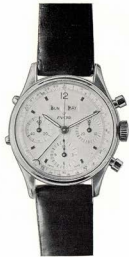
エニカ シェルバ グラフ ディテイト 商品番号 EG-11-129 35mm 秒測計 分積計 時積計 セコンド付 月・曜日・カレン ダー及時進計付 防水割 耐震耐磁耐熱装置付 S/S ¥52,000

この頁以降に掲載されている時計にはすべて一年間新品交換保証と盗難火災保険保証がつけられて居ります。御買上げ後一ケ年以内に万一機械が故障したり、盗難又は火災の被害を受けられた時は同種類の新品と交換又は補償いたします。