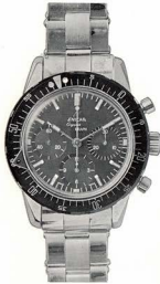
エニカ アクア グラフ 商品番号 EG-13-100 40mm 潜水用経過時間記憶装置 付 秒測計 分積計 時積計及 セコンド付 オールステンレス 超完全防水割 耐圧30気圧 水深300米 耐震耐磁耐熱装置付 舶来額付 ¥55,500