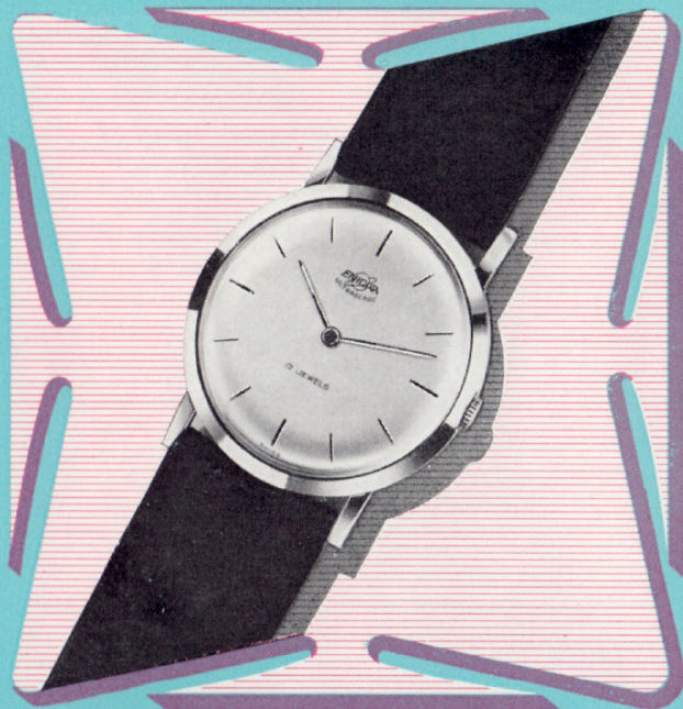
Ref. 200/30 P 8¾" Ø 33 mm

Extraflaches Modell mit rassigem Profil, ausgerüstet mit einem Werk, das auch die Anspruchsvollsten in Erstaunen versetzen wird. Lieferbar in Goldplaque 20 Mikron und in rostfreiem Stahl.