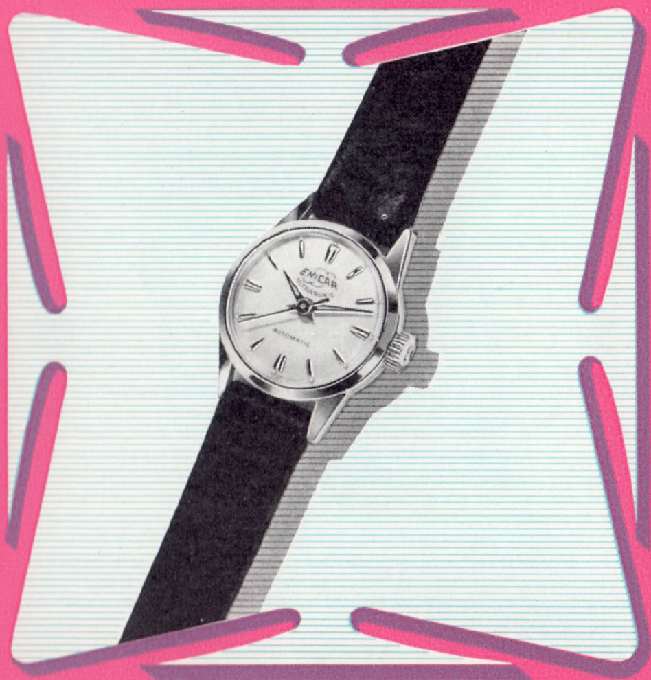
Ref. 344 AMPS 7 3 / 4 '' Ø 20,5 mm

Diese Uhr wurde vor allem für die aktive Berufsfrau geschaffen, die sich eine präzise, elegante und doch widerstandsfähige Uhr wünscht. Das Golddoublé-Gehäuse in 20 Mikron ist wasser- und staubdicht. Dazu kommt noch der praktische, automatische Rotor-Aufzug. Diese gefällige Uhr ist ebenfalls mit Chromgehäuse und Stahlboden erhältlich.