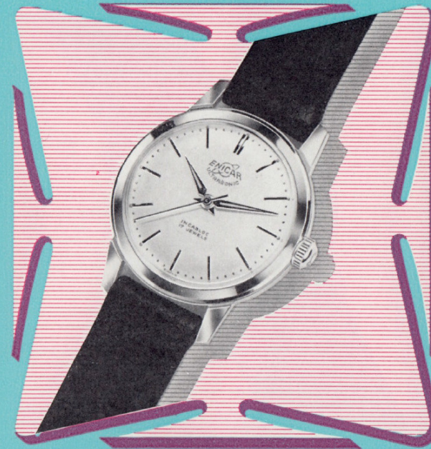
Ref. 100/19 MLS 11½" Ø 33 mm

Hochpräzises Werk in verchromtem Gehäuse mit angeschraubtem Stahlboden oder 20 M. Golddoublé-Gehäuse mit Stahlboden. Eine Qualitätsuhr, die in dieser Preislage einzig dasteht.