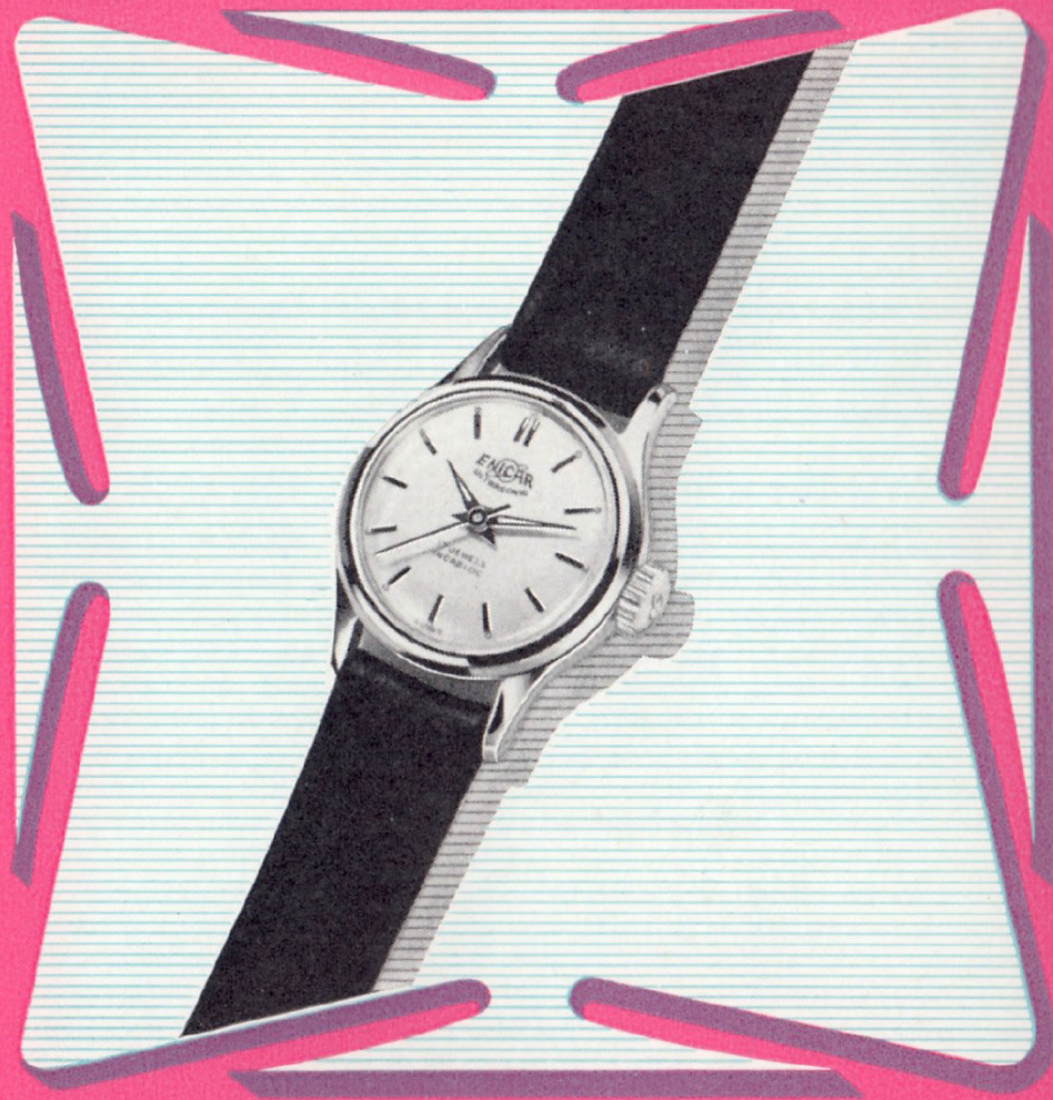
Ref. 347 S 7 3 / 4 '' Ø 20,5 mm

Ein Modell mit Chromgehäuse, dessen unbestrittener Wert Sie sehr schätzen werden. Das wasserdichte Gehäuse, das hochpräzise Werk und die klassische Form sind Einzelheiten, die die sportlich elegante Dame begeistern werden.