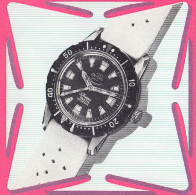
Ref. 100/116 BaANXS Sherpa DIVETTE Ø 36 mm

Sie ist mit einem verstärktem SEAPEARL-Gehäuse (Patent ENICAR) ausgerüstet und widersteht einem Wasserdruck, der 200 m Meerestiefe entspricht. Das schwarze Zifferblatt von vollendeter Lesbarkeit wurde speziell für die Erfordernisse der Tiefseetaucherei geschaffen. Der robuste, graduierte, drehbare Ring ist leicht zu handhaben. Die SHERPA-Divette besitzt ein ENICAR-Werk mit automatischem Selbstaufzug. Herr Dr. Hans Hass schenkt ihr sein Vertrauen, Sie können es auch.