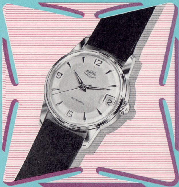
Ref. 100/50 BACEPS 11½" Ø 34 mm

Ein elegantes Modell mit dem berühmten Seapearl-Gehäuse, 100 % wasserdicht, selbst bei einem Druck, der 50 m Seetiefe entspricht. Automatischer Selbstaufzug. Datum vergrößert, also gut lesbar, dank einer von ENICAR geschaffenen Linse. 20 M. Golddoublé-Gehäuse mit Stahlboden oder Chromgehäuse mit Stahlboden.