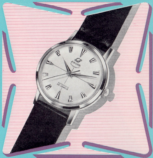
Ref. 100/106 AGS 11½" Ø 34,5 mm

Ein Luxusmodell in 18 Karat Gold für festliche Gelegenheiten. Das 100 % wasserdichte Gehäuse hebt sich vor allem durch seine klassischen, geraden Linien hervor, die den vornehmen Herrn ansprechen werden.