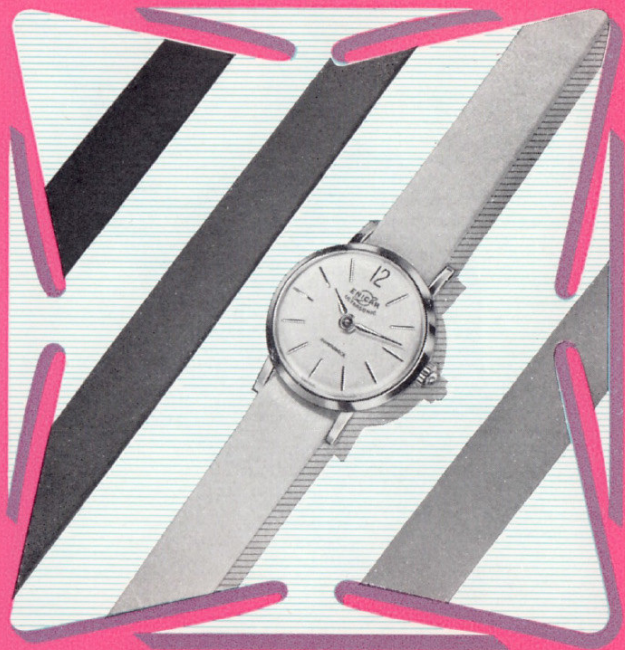
Ref. 500/157 P 5" Caroline