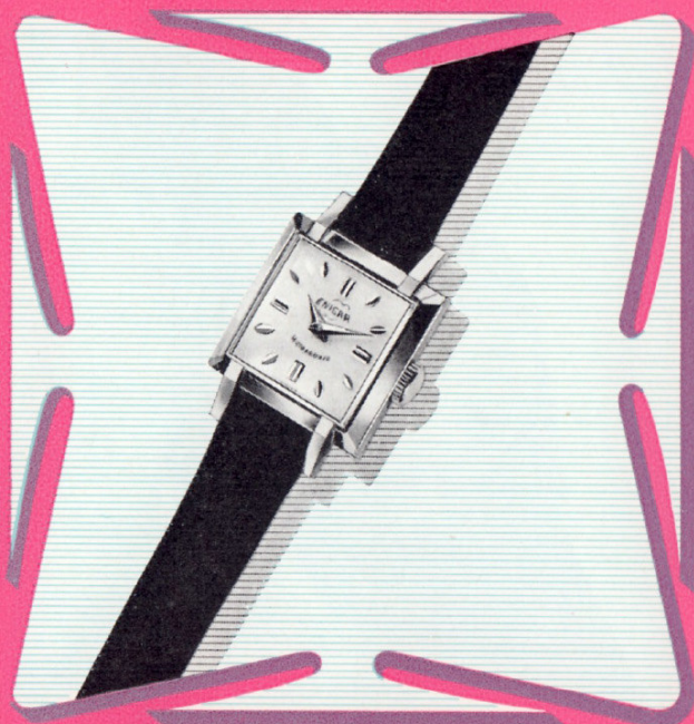
Ref. 500/171 G 5"

Die Modellisten der ENICAR setzen ihren Stolz darin, immer zur Avantgarde der Mode zu gehören. Dieses Modell in 18 Karat Gold legt mit seinen einzigartigen Linien Zeugnis davon ab. Zifferblatt mit Goldrelieffziffern. Ebenfalls lieferbar in 20 Mikron-Golddoublé.